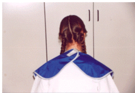
AN42 - S